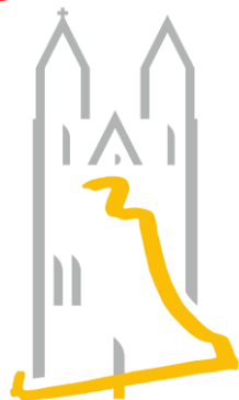
Domglocken Magdeburg e.V.