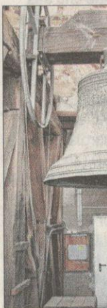
Die klanglich sch glocke „Domenic zehn Jahren. Sie und umgehängt erst mit dem Ge

Blick in die Ob der Dom fr Glocken hatte. Aktuell hängen glocken im drit Stockwerk des Es gibt die dre cken „Susanne „Apostolica“ (u und „Domenic defekt). Die Kosten fü Glocken, daru nen eine Refor belaufen sich gen auf rund 5 ohne Einbau, C und Verzierung müssen aber a aktualisiert w